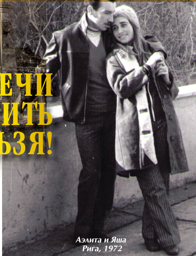
Аэлита и Яша Рига, 1972

Концерт “Вокруг света за 60 минут” , который состоится 2 сентября , будет носить несколько иной характер – интернациональный. На нём будут присутствовать представители посольств и другие почетные гости. Аэлита исполнит для них песни разных стран – ведь она поёт на 16 языках. Весь сбор от этого концерта поступит в Фонд создания Музея рижского гетто . Рижская Дума передала Еврейской общине здание в Московском форштадте для экспозиций музея-мемориала.