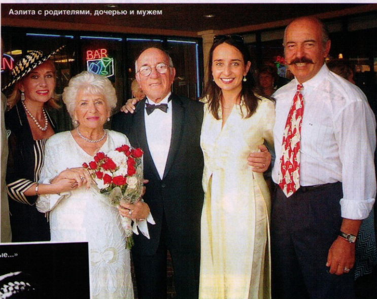
Азлита с родителями, дочерью и мужем